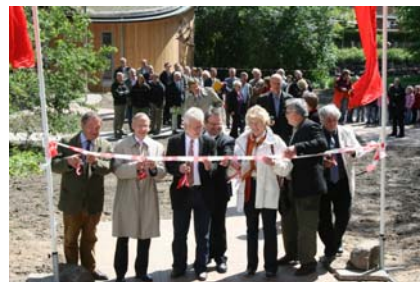
Eröffnung am 14.05.2009

Die Sparkassen-Stiftung Stormarn finanziert einerseits den Einsatz speziell ausgebildeter Förster und Försterinnen (der Landwirtschaftskammer Schleswig-Holstein), die vor Ort die pädagogischen Aktivitäten mit Kindern, Erziehern und Lehrkräften durchführen, andererseits sorgt sie für die organisatorische Abwicklung (vor allem der Vereinbarung der Termine) in Verbindung mit dem Kreisjugendring Stormarn e.V. sowie den Transport der Kinder mittels Bussen (durch die Firma Autokraft).