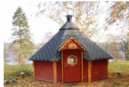
Kota „Kaninchenbau“ der Sparkassen-Stiftung

Die Sparkassen-Stiftung Stormarn hat dabei die Kosten für den Niedrigseilgarten übernommen und drei eigene Kotas sowie sechs Container zur Unterbringung von Spielfahrzeugen für die Kindergartenkinder auf dem Gelände in Grabau errichtet.